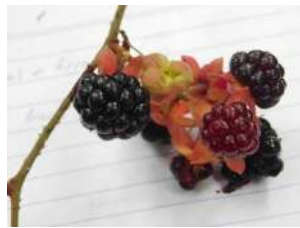
Rubus cf glomeratus