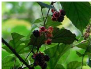
Rubus cf glomeratus